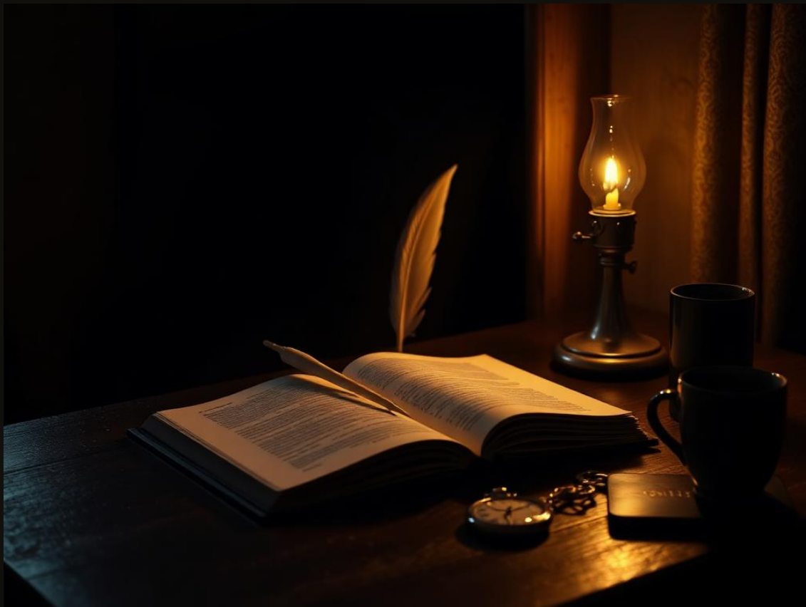
Figura 1 — Mesa de trabalho de quem cultiva o silêncio: livro, pena, lâmpada discreta. Quatro objetos que mexem com a fisiologia humana mais do que muito remédio de tarja.

Falar é caro para o organismo. Cada vez que você abre a boca para uma fofoca, uma queixa, uma reação imediata a um post , três coisas acontecem em menos de 10 segundos: a amígdala cerebral dispara, o cortisol sobe na corrente sanguínea, e o tônus simpático assume o comando do coração. Frequência cardíaca acelera. Pressão arterial sobe 8 a 14 mmHg. Variabilidade da Frequência Cardíaca (VFC) despenca.