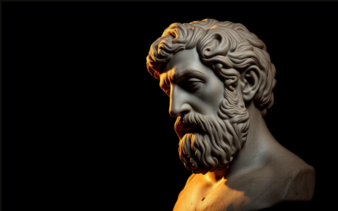
Figura 1 — Aristóteles de Estagira (384 a.C. – 322 a.C.), discípulo de Platão, mestre de Alexandre, filho do médico de corte Nicômaco.

Aristóteles nasceu em Estagira, no norte da Grécia, e foi criado dentro de uma casa onde se tratavam pacientes. Seu pai, Nicômaco, era médico pessoal do rei Amintas III da Macedônia. O menino aprendeu anatomia antes de aprender retórica. Por isso, quando, décadas depois, escreveu sobre ética, escreveu como médico: descrevendo doenças (os vícios), sintomas (os extremos) e a única cura possível (o meio).